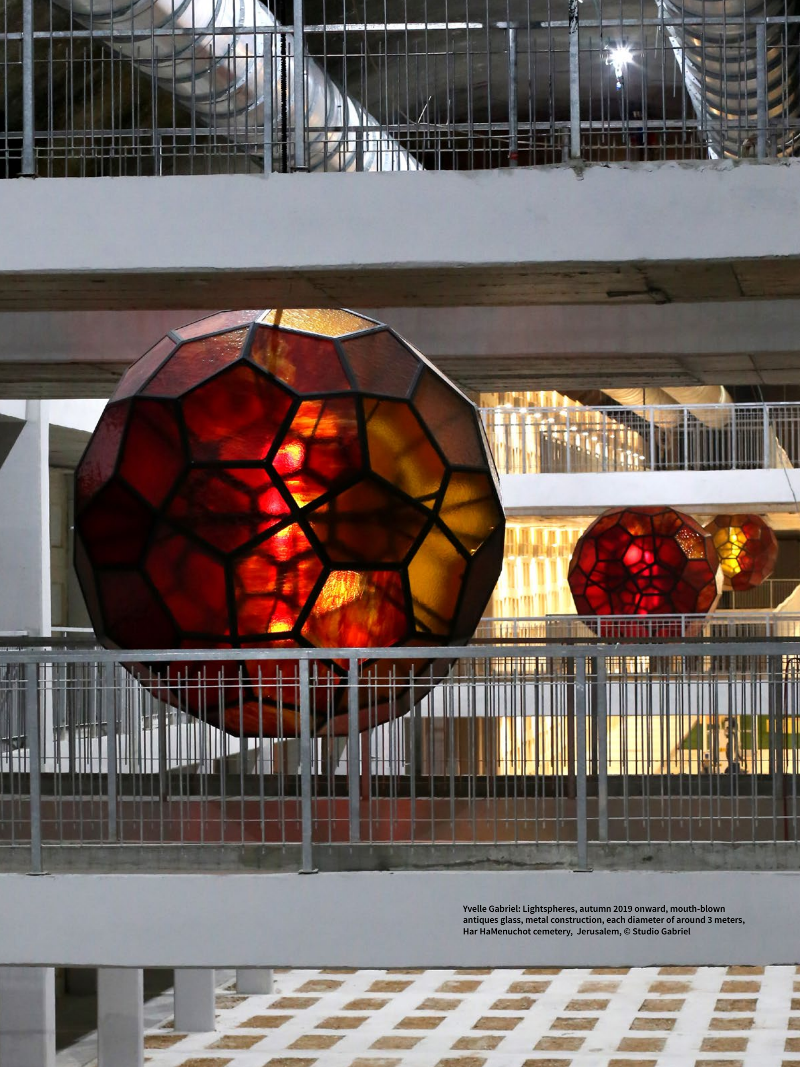
Yvonne Gabriel: Lightspheres, autumn 2019 onward, mouth-blown antique glass, metal construction, each diameter of around 3 meters, Har HaMenuchoth cemetery, Jerusalem, © Studio Gabriel