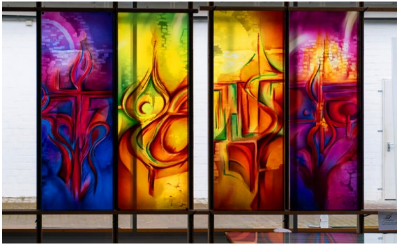
Yvelle Gabriel: Windows for the new building of the Caritaszentrum Clara in the diocese Erfurt in Weimar, Germany, 2020, © Studio Gabriel

len Weiterentwicklung des Dodekaeders, der essentiell aus zwölf Fünfecken besteht. Er verweise zudem in der Zahlenmystik der Kabbala auf die Zuordnung zum 5. Element des „Äthers“ - der Quintessenz aller vier Elemente, so Gabriel. Jeweils zwei miteinander verbundene Kugelsphären aus Leichtmetall und Glas sollen „sinbildlich die Aura und Lichtkraft der Sonne - der Fackel des ewigen Lebens - in die dunklen Katakomben bringen“.