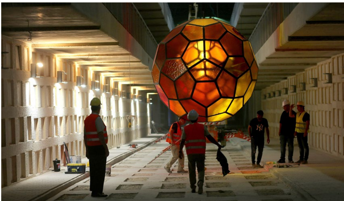
Yvonne Gabriel: Lightspheres, autumn 2019 onward, mouth- blown antiques glass, metal construction, diameter of around 3 meters, Har HaMenuchot cemetery, Jerusalem, © Studio Gabriel

In late October 2019, the subterranean cemetery was partially opened with the first 8000 graves. A good year earlier, the Jerusalem Jewish Community Burial Society